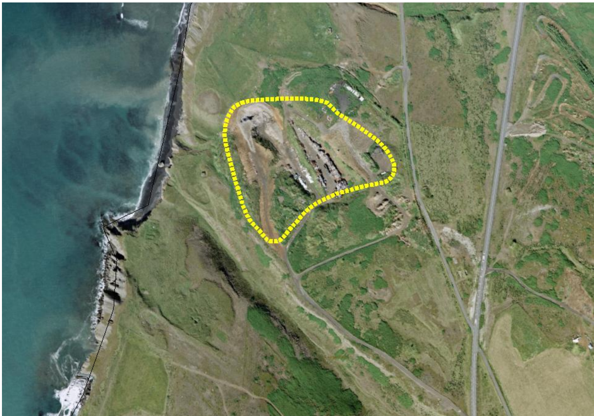
Mynd 1. Afmörkun sorpurðunarsvæðisins eins og hún er í aðalskipulagi Norðurþings 2010-2030

Stærð skipulagssvæðisins samkvæmt aðalskipulagi er 6,7 ha. Aðkoma að svæðinu er frá Norðausturvegi nr. 85.