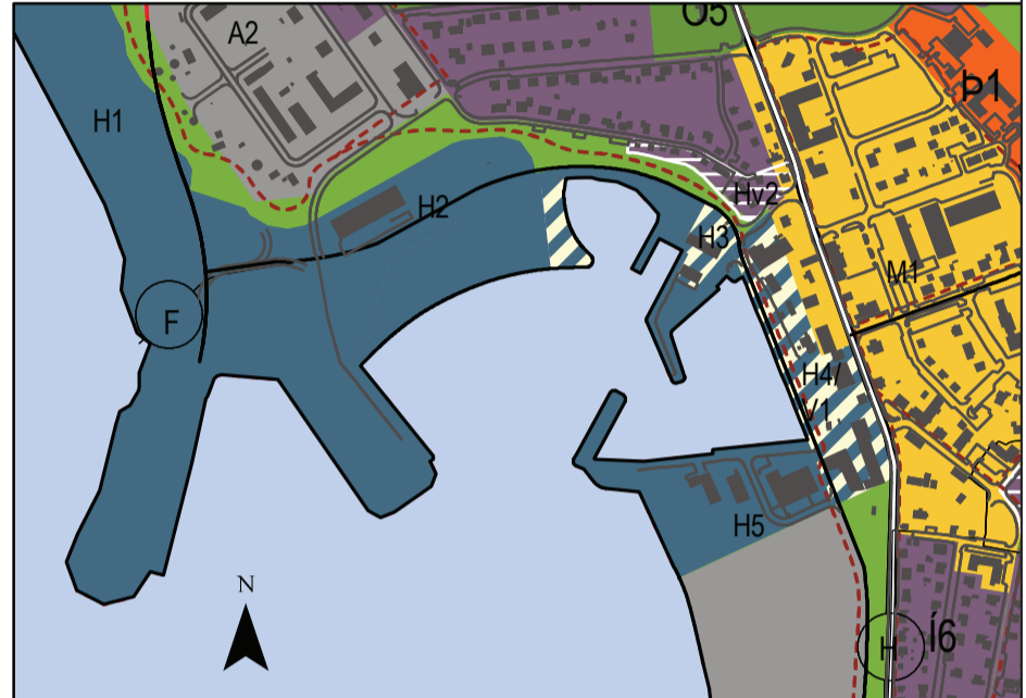
Breyting á aðalskipulagi Norðurlands 2010-2030 / Húsavík