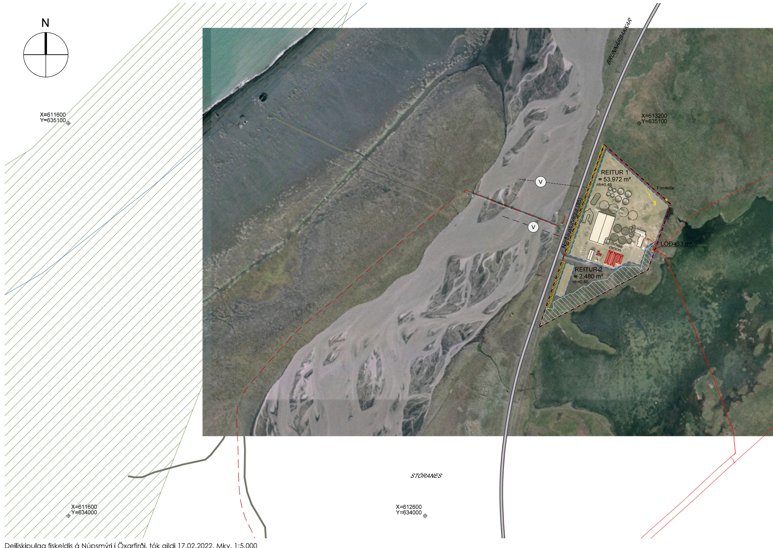
Deiliskipulag fiskeldis á Núpsmýri í Öxarfirði, tók gildi 17.02.2022. Mkv. 1:5.000