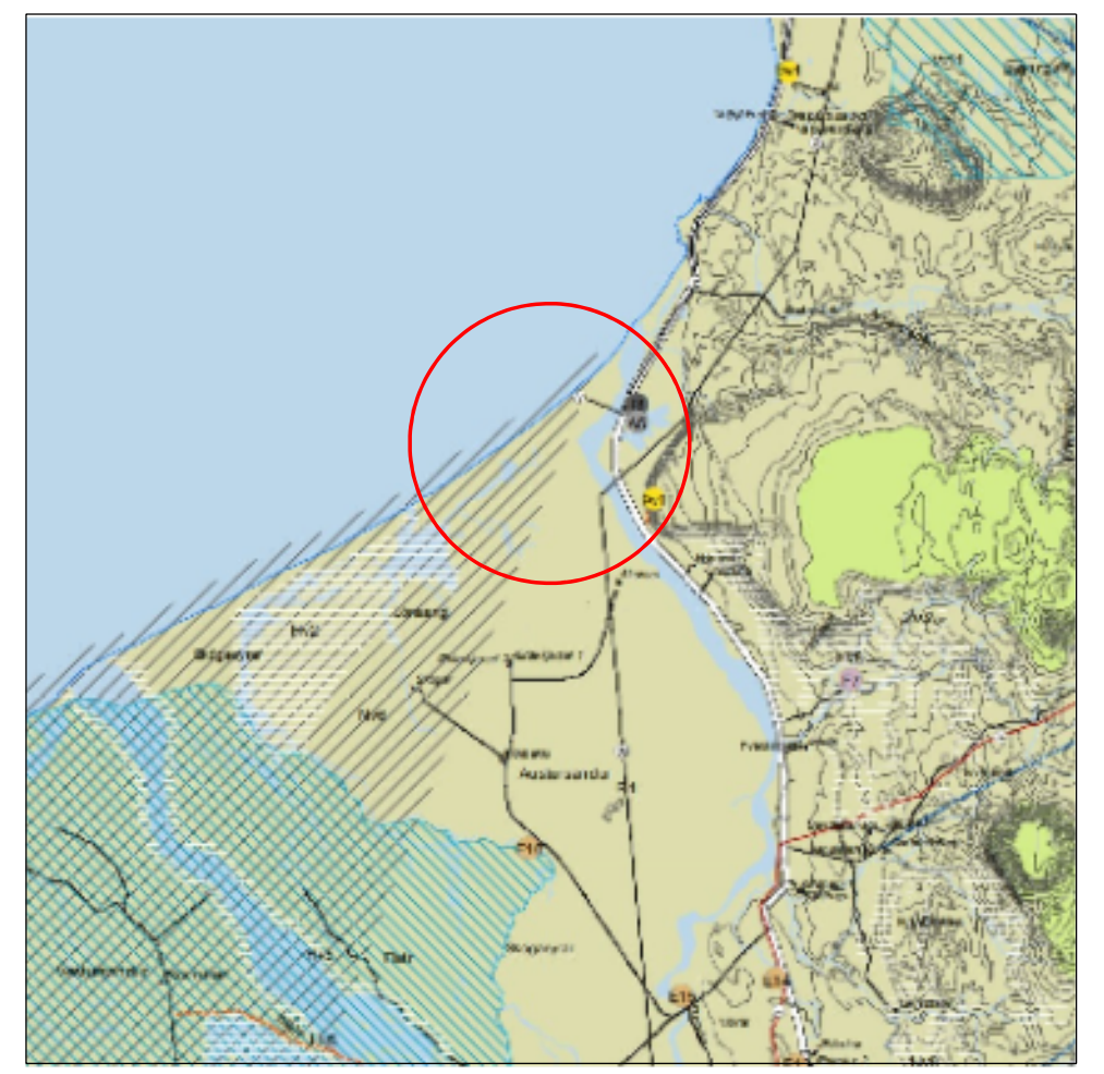
Aðalskipulag Norðurlands 2010-2030, staðfest 22.12.2010.