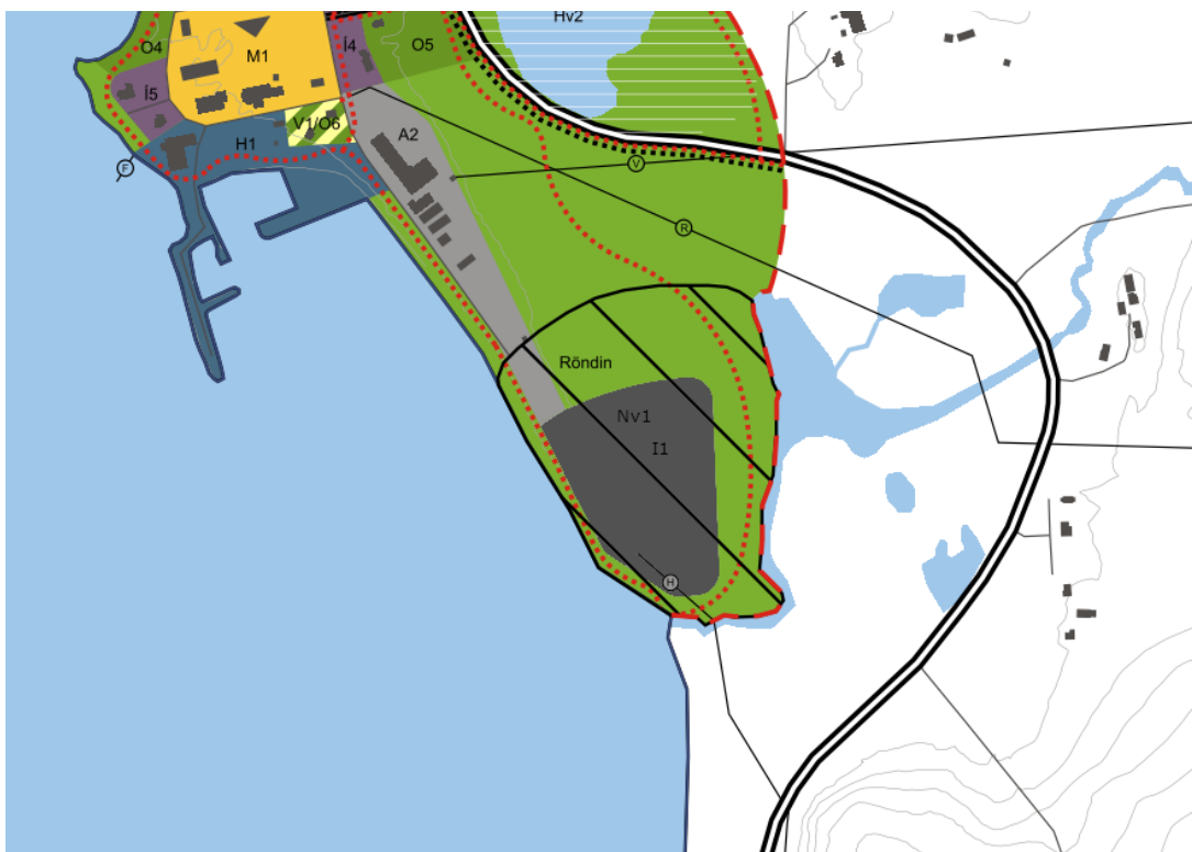
Mynd 5: Þéttbýlisuppráttur fyrir Kópasker eftir breytingu, 1:10000.