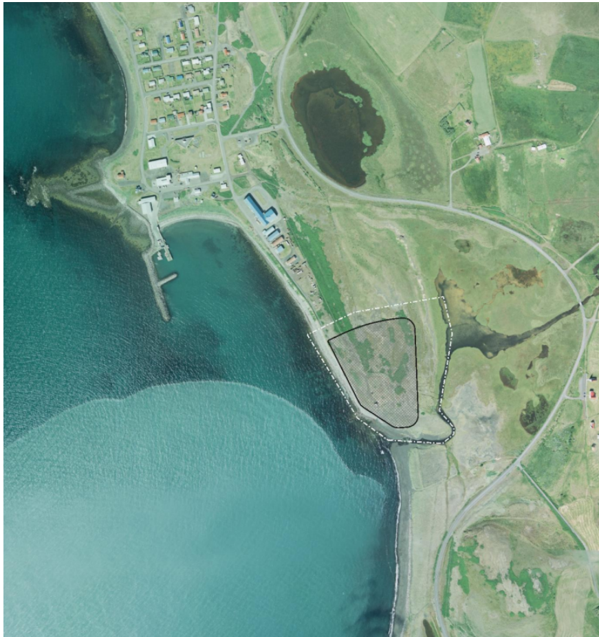
Mynd 1: Hvíta brotalínan sýnir mörk deiliskipulags sem kynnt er samhliða þessari breytingu á aðalskipulagi.

Samhliða þessari breytingu á aðalskipulagi er kynnt tillaga að deiliskipulagi þar sem tilhögun mannvirkja er skilgreind nánar.