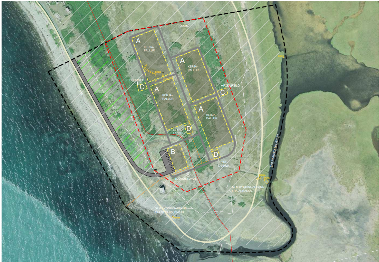
Mynd 3: Fyrirkomulag mannvirkja skv. tillögu að deiliskipulagi.