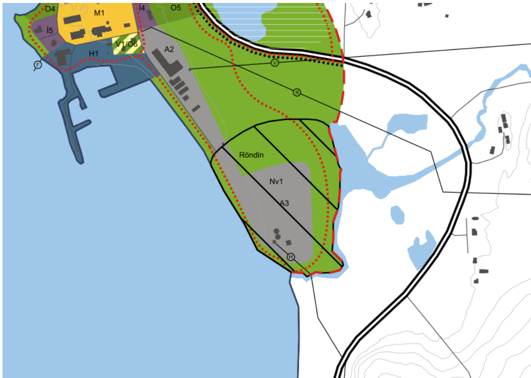
Mynd 4: Þéttbýlisuppráttur fyrir Kópasker fyrir breytingu, 1:10000.