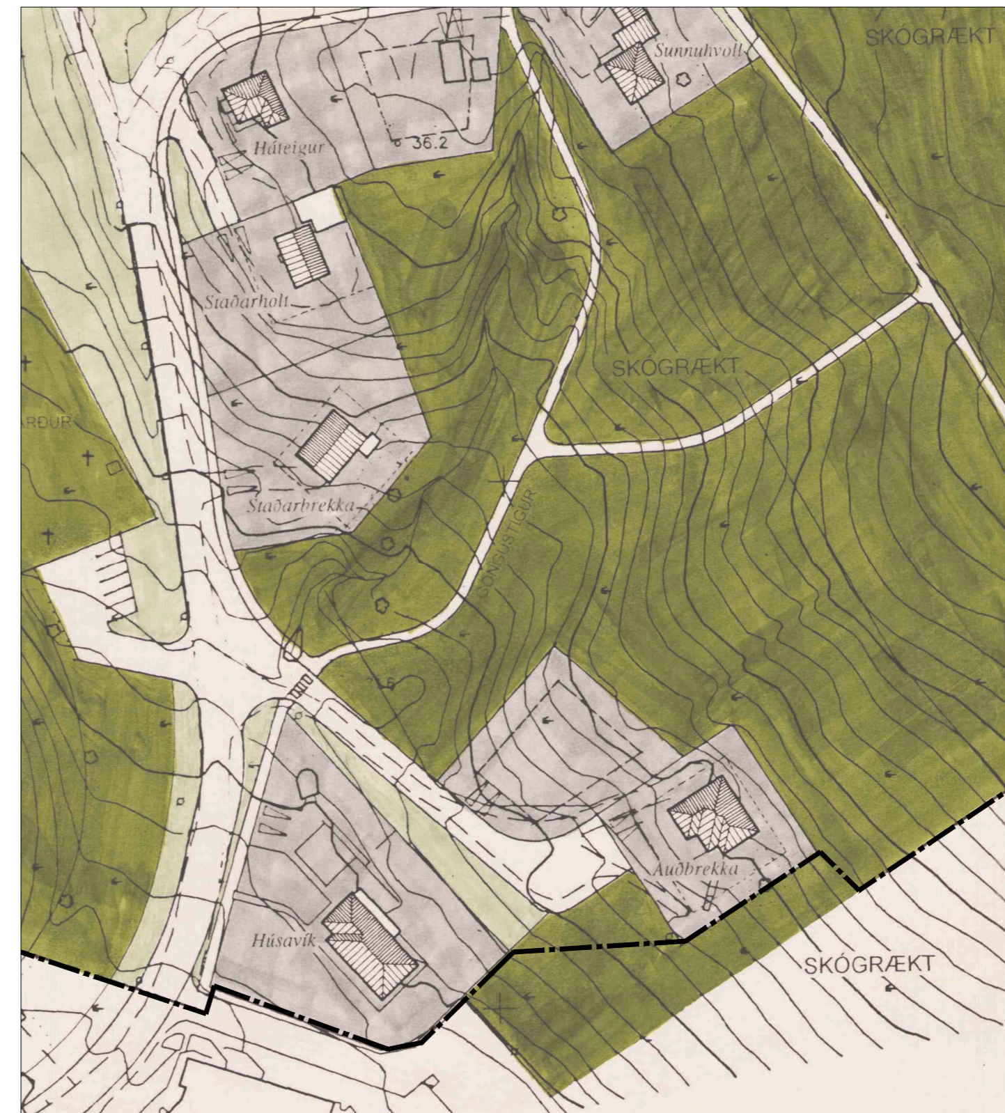
Tillaga að breyttu deiliskipulagi í mkv. 1:1000

Í breytingunni felst að mörk deiliskipulagsins fylgja lóðamörkum Auðbrekku 8 og Auðbrekku 4 og 6 að austan í stað skógræktarsvæðis í Húsavíkurfjalli. Að öðru leyti er deiliskipulagið óbreytt.