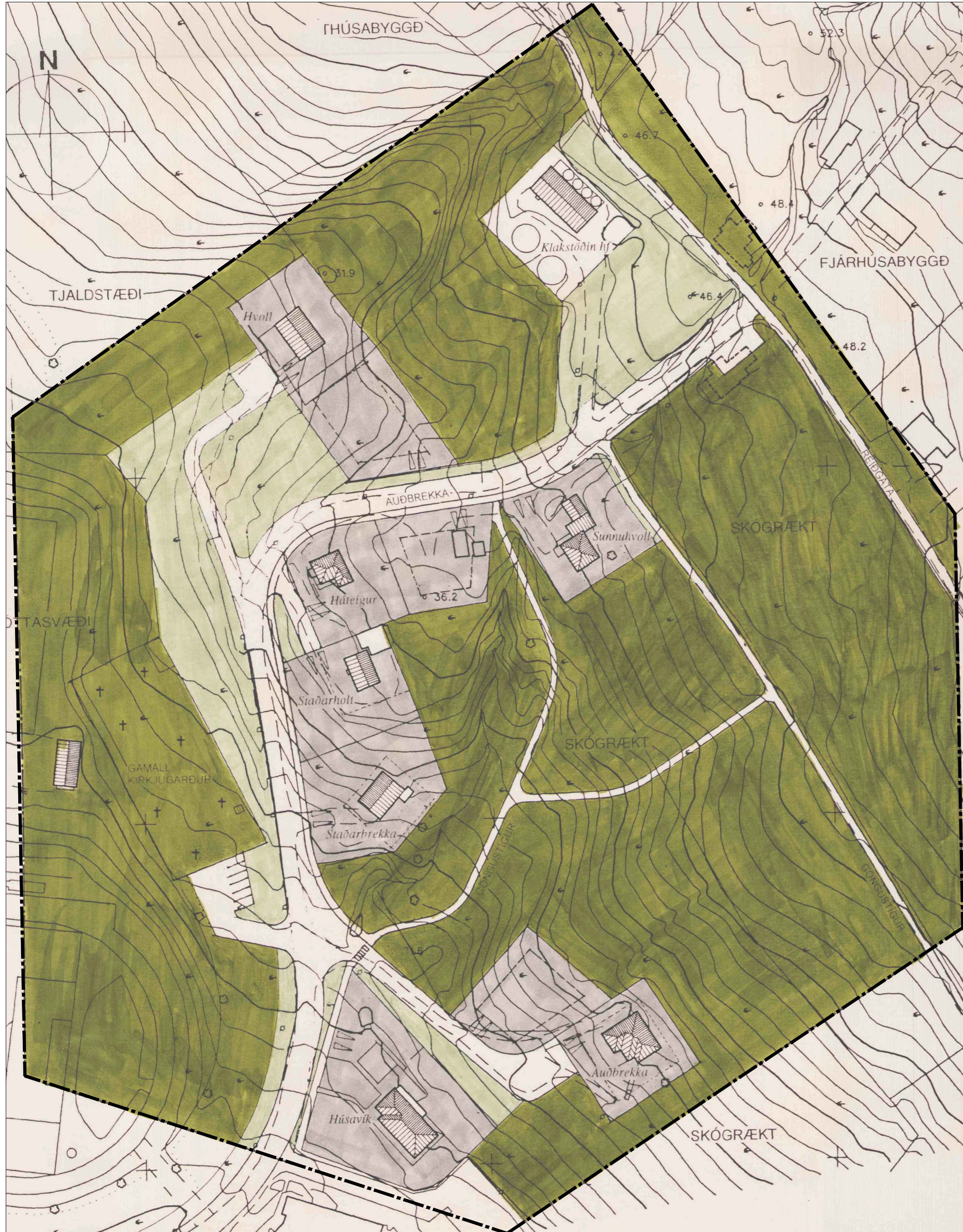
Deiliskipulag íbúðarsvæðis við Auðbrekku á Húsavík dags. 1. desember 1992, í mkv. 1:1000.

Gerð er tillaga að breytingu á deiliskipulagi íbúðarhúsnæðis við Auðbrekku í samræmi við 43. gr. skipulagslaga nr. 123/2010.