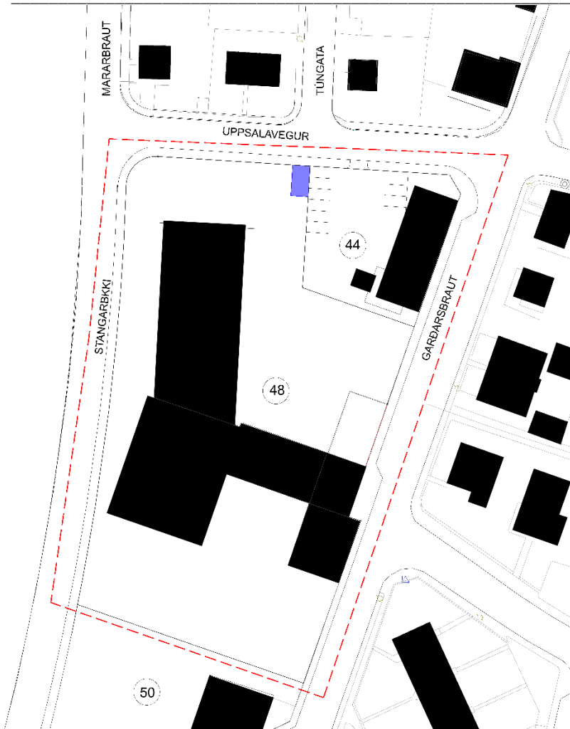
Mynd 2 Drög af fyrirhuguðu deiliskipulagi ásamt skipulagsmörkum. Fyrirhuguð lóð RARIKs er sýnd með bláum ferhyrningi.